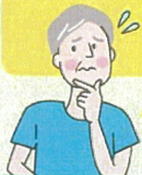
商業ビル所有 Tさん